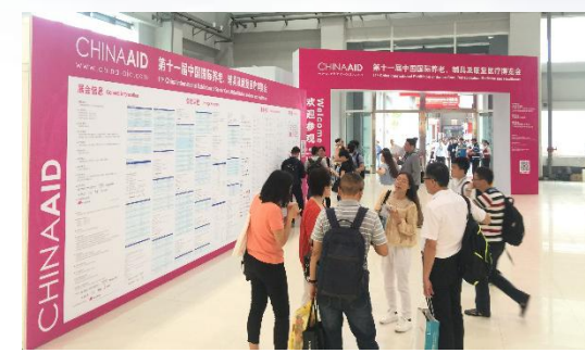
China Aid 开幕